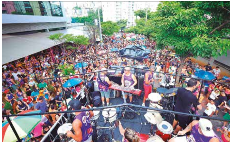
Blocos GANDAHIA, ELIS IDEAL e QUEM EU QUERO NÃO ME QUER prometem levar milhares de FOLIÕES às ruas do Buritis

“2026 vem com um maior frio na barriga pra gente. Como 2025 foi o primeiro ano, não tínhamos como mensurar o que poderia vir do nosso bloco. Entretanto, só tivemos elogios e várias pessoas que não foram em 2025 me encontram na rua e falam: “esse ano