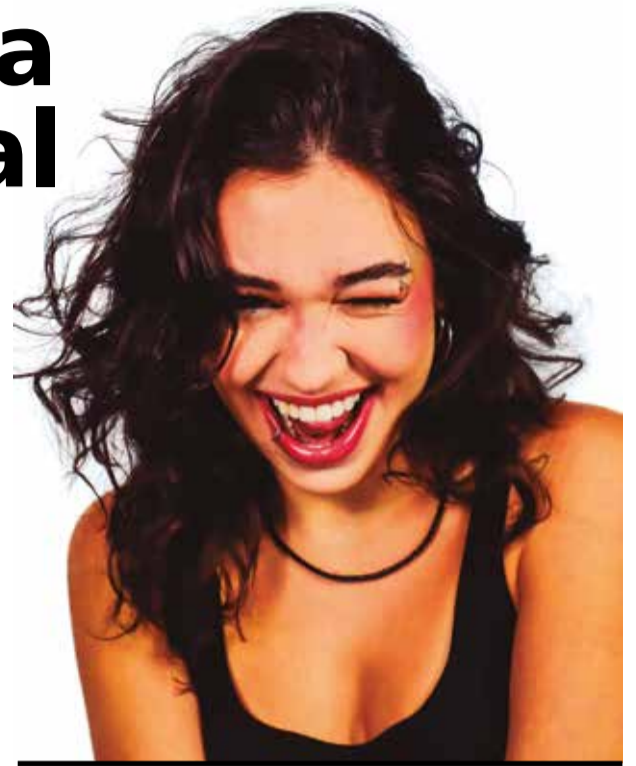
MÚSICA já está disponível nas principais PLATAFORMAS DE STREAMING

A gravação e lançamento de Sentimento Exacerbado ocorreram no estúdio Música aos Montes, onde, inclusive,