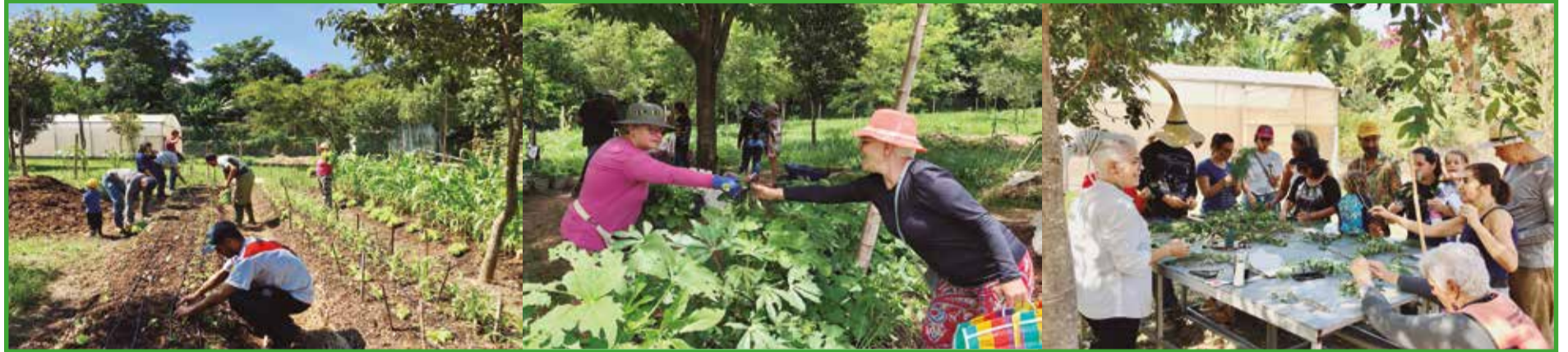
A HORTA COMUNITÁRIA do CEMAR tem transformado vidas. Ela FORTALECE a união comunitária, OFERECE terapia ocupacional e PROPORCIONA alimentos frescos e sem agrotóxicos para as famílias

Muitos moradores do Buritis não sabem, mas aqui bem próximo, no vizinho Estoril, existe uma importante horta comunitária. O Centro Municipal de Agroecologia e Educação Ambiental para Resíduos Orgânicos (Cemar) possui jardins, pomares, estufas, viveiros de mudas e plantas medicinais, pista de caminhada e uma academia a céu aberto. No local, são produzidos alimentos, sementes e insumos que podem ser usados nos sistemas agroecológicos da cidade.