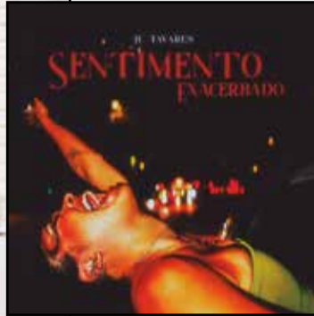
“SENTIMENTO EXACERBADO” é uma canção que mostra todo o talento de JU TAVARES

Parte de uma base de pop rock, com bateria acústica, e se mistura com beats de bateria eletrônica, que dialogam com o R&B e o rap,