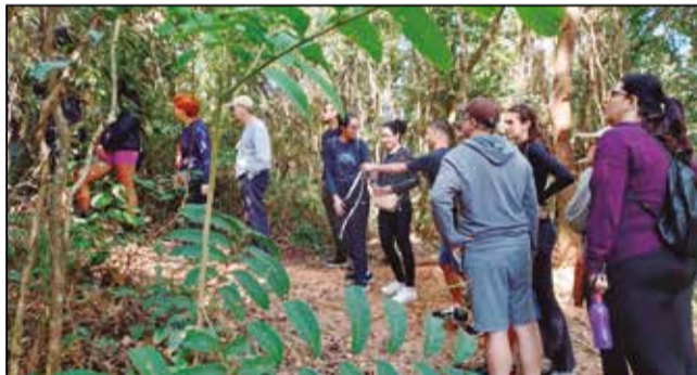
Ao participar das TRILHAS, os visitantes estão tendo a oportunidade de conhecer a FLORA E A FAUNA do parque bem de perto