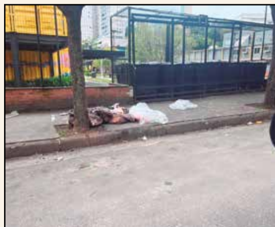
MAU-CHEIRO vindo do LIXO segue incomodando pedestres e moradores vizinhos