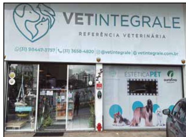
As PARCERIAS foram fundamentais para o SUCESSO de arrecadação na primeira campanha

felicidade e gratidão em poder contribuir de alguma forma para melhorar a vida destes animais necessitados, e ainda contribuir, mesmo que de forma modesta, na redução da produção de lixo em busca de um mundo melhor”.