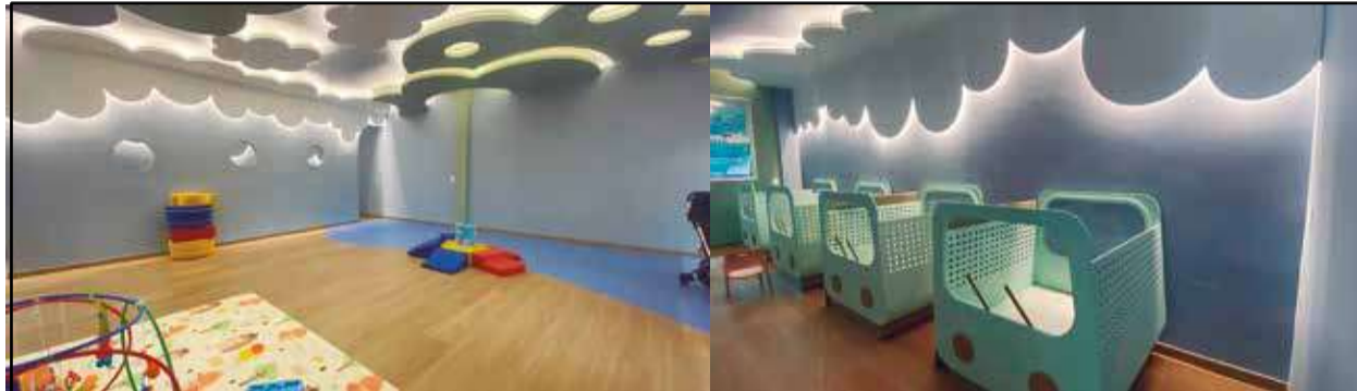
Direção do BATISTA não poupou esforços para criar a MELHOR ESTRUTURA de um berçário

Assim, desde o início deste ano o Batista Buritis oferece a educação do Berçário. O local escolhido dentro do Colégio não poderia ser mais acolhedor: uma área próxima à natu-