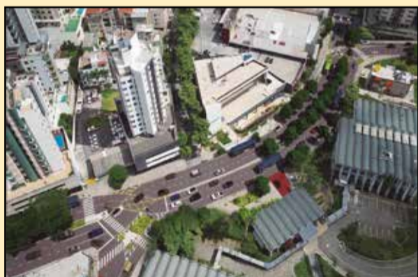
Implantação da MÃO INGLESA na Mário Werneck é uma das propostas apresentadas que mais chamou atenção

Durante a audiência pública foram apresentados quatro cenários de intervenção na Av. Prof. Mário Werneck que foram projetados pela empresa Eco Minas, a partir do estudo de circulação. Um dos cenários que gerou melhor resultado nos estudos foi a implantação de mão inglesa no trecho entre as Ruas Líbero Leone e José Rodrigues Pereira. Essa proposta tem um ganho operacional de 30% na velocidade da via em momentos de pico.