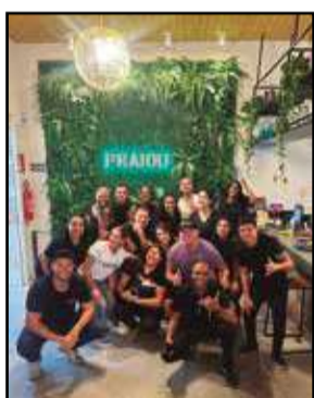
Com cerca de 2 mil m² de área construída, o PRAIOU conseguiu reunir o melhor serviço de ESPORTES DE AREIA, lazer e gastronomia

Com cerca de 2 mil metros quadrados de área construída, o Praiou conta com cinco quadras de areia com excelência em todos quesitos. Da escolha da areia, da iluminação, a área de escape e até mesmo câmara que filma os melhores lances.