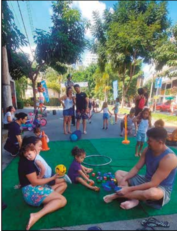
PAPAIS, MAMÃES e CRIANÇAS aproveitaram o domingo de PURA DIVERSÃO ao ar livre