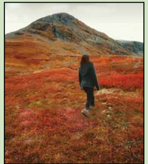
EVENTO tem o intuito de alertar sobre a PRESERVAÇÃO de nossas NASCENTES através de uma atividade de lazer

A caminhada é simples e gratuita. Os organizadores pedem apenas que os participantes não se esqueçam de passar repelentes, protetor solar e levar água e fruta. “Também pedimos que levem sacolinhas para guardarmos nosso lixo e possíveis lixos que encontrarmos pelo caminho e, assim, contribuirmos com a limpeza do local”.