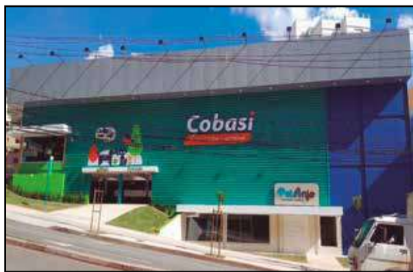
COBASI do BURITIS oferece uma EXTENSA VARIEDADE, com mais de 20 mil produtos nas linhas pet e de jardinagem