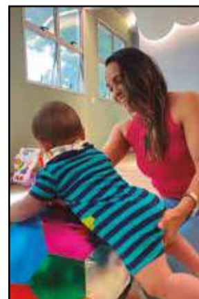
Bebês são EDUCADOS com profissionais ESPECIALIZADOS

O berçário possui uma estrutura arquitetônica moderna, com lactário, fraldário, espaço do sono e estimulação. Além disso, o local é todo monitorado por câme-