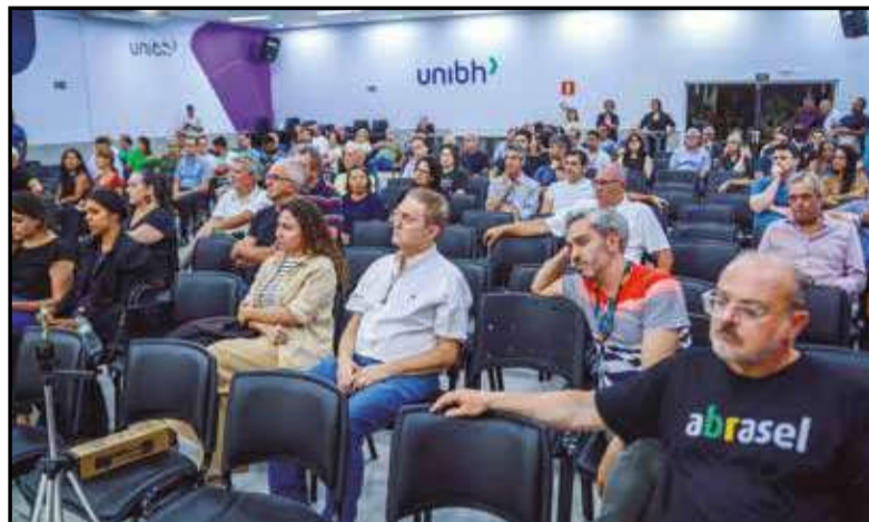
O que se viu do PÚBLICO foi uma GRANDE INDIGNAÇÃO pela não presença da BHTrans