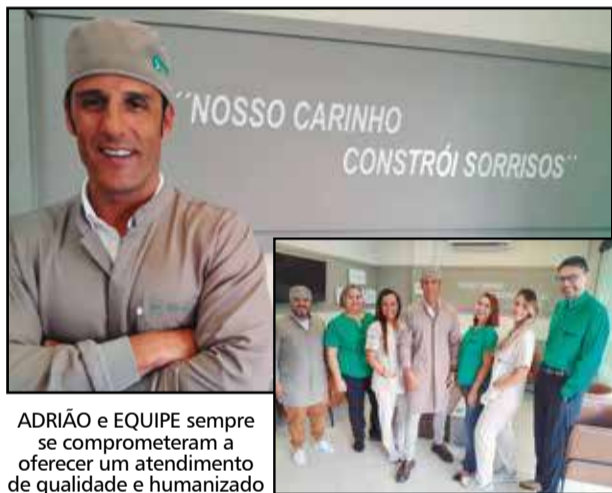
ADRIÃO e EQUIPE sempre se comprometeram a oferecer um atendimento de qualidade e humanizado

A ORAL SIN fica localizada na Av. Prof. Mário Werneck, 3210, próximo à Escola Americana. O local conta com estacionamento gratuito. Contato pelos telefones 3568-1620 e 9 9878-2189. Instagram @oralsinburitis.